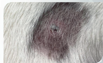
Wratje na 1 behandeling