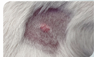
Wratje voor behandeling